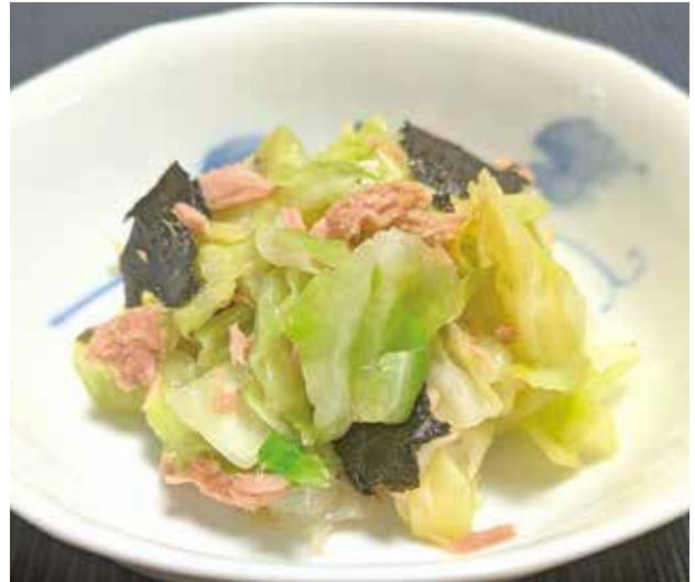
(1人分：エネルギー69kcal 塩分0.4g)