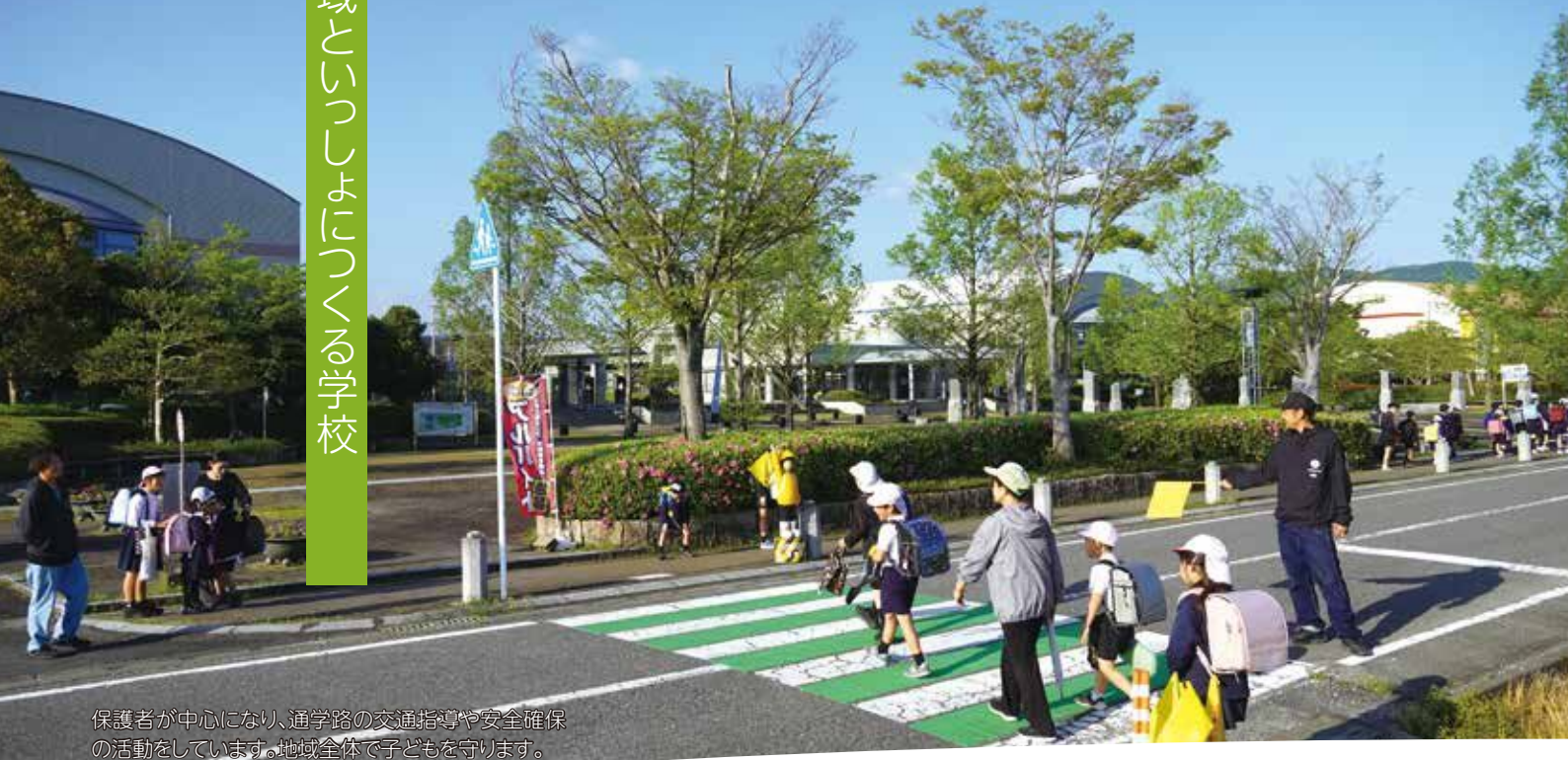
保護者が中心になり、通学路の交通指導や安全確保の活動をしています。地域全体で子どもを守ります。