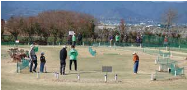
▲子どもも参加して、和やかな雰囲気ですべてを楽しみました。

有明地域づくり協議会主催のパークゴルフ大会が開催され、36人が和やかな雰囲気の中でプレーを楽しみました。世代を超えたつながりの場として、地域の交流が深まる1日となりました。