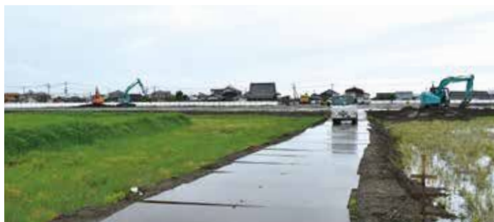
▲令和12年度の開校を目指す新設白石地域小学校の用地造成工事が進んでいます。教育環境の整備は子育てには欠かせない要件です。（白石中学校北）

子育て世代にとって、「どんな学校があるか」は、住む場所を考えるうえでとても大切です。白石町では、教育環境の充実と整備を進めることが、子育て世代の定住にとって大切だと考えられています。学びの内容だけでなく、施設や設備、地域とのつながりも含めて、子どもをまんなかにした環境が整っていくことは、この町で安心して暮らしていく力にもなります。教育の充実、町の未来を支える土台でもあります。