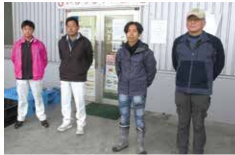
▲私たちが回収しました

佐賀県農業協同組白石地区、(有)佐賀東部青果、(株)マルハ園芸、(株)吉森、(有)龍鳳53