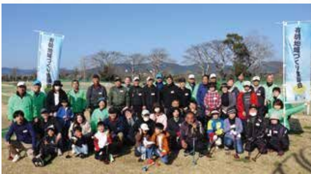
▲参加者全員で記念写真