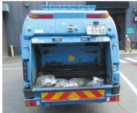
▲回収した罹病株は、さが西部クリーンセンターで処分しました。