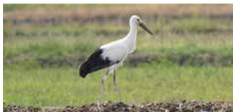
▲ J0959 メス 「かりん」