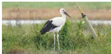
▲ J0960 メス 「なつ」