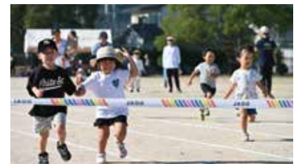
▲ 30m走(未就学児) 有明地域