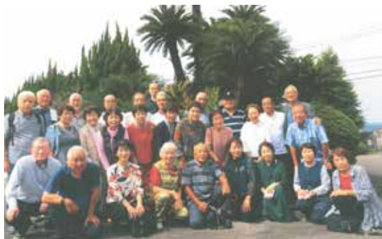
▲ 白石小学校 昭和35年度卒業生の皆さん