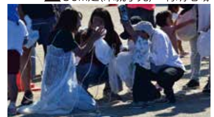
▲ 宝さがし 白石地域