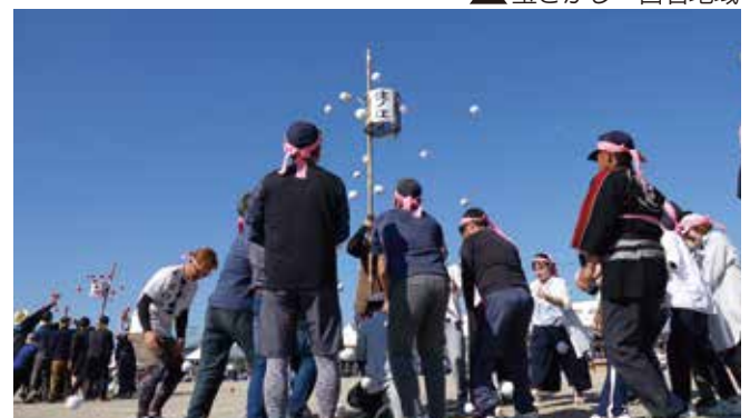
▲ 玉入れ 福富地域