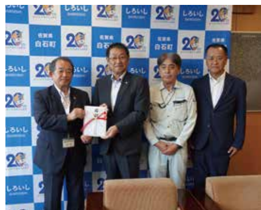
▲ 唐津土建・富士建設共同企業体の皆さん(右の3人)