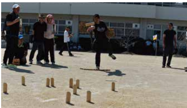
▲ モルック競技 白石地域