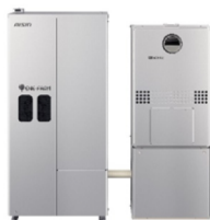
家庭用燃料電池（エネファーム）