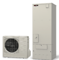
ヒートポンプ給湯機（エコキュート）