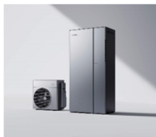
ハイブリッド給湯機