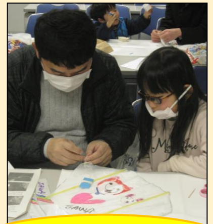
最後は手伝ってもらって完成！