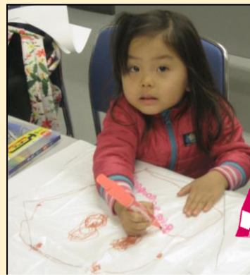
じょうずに描けるかな？