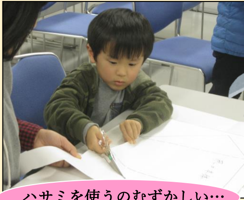
ハサミを使うのむずかしい…