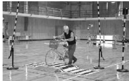
■踏切は、自転車から降りて渡りましょう

また、白石警察署管内では、「杵島郡はっけん運動(反射シールを貼っけん、車から発見してもらおう)」が実施されています。靴に貼れる反射シールを役場総務課や白石警察署で高齢者の人に無料で配布しています。ご家族でぜひ貼って活用してください。