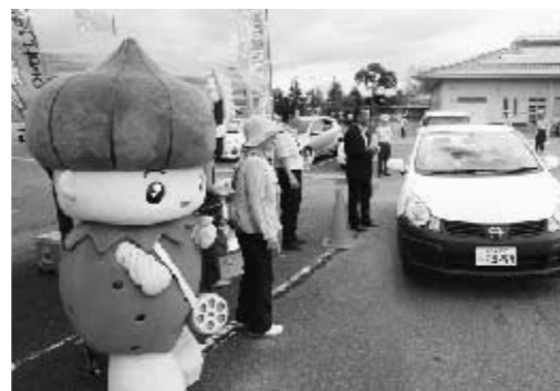
■みのりちゃんも交通安全をよびかけました

10月1日からは夕暮れ時の早めのライト(前照灯)点灯運動が実施されています。ドライバーの皆さんは、午後5時から前照灯を点灯しましょう。歩行者や自転車から外出するときは反射材を使用しましょう。