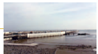
新有明海漁港 防災カメラ放送開始

防災チャンネルをご覧いただく為には、チャンネルの再設定が必要な場合があります。 「防災チャンネル」をご視聴頂く為には、ケーブルワンのケーブルテレビサービスへのご加入が必要になります。詳しくはケーブルワン白石営業所までお問い合わせください。