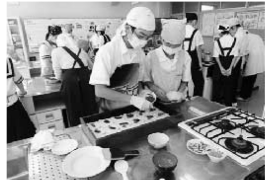
■盛り付けが意外に難しい

親子料理教室では、食生活改善推進協議会のヘルスマイトの方から栄養についての話を聞き、親子で食生活の改善について考えました。その後は、親子のふれあいを深めながら調理をし、子どもたちからは、「家でもつくってみたい」との声もありました。