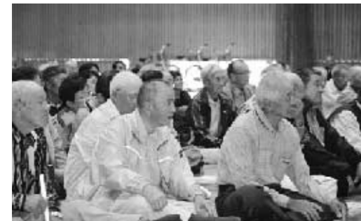
■楽しい寸劇に思わず笑みがこぼれます

篠原警察署長から、「白石町は高齢者の事故数の伸び率が一番。身体機能の衰えが事故につながるので、自分のペースで無理な運転をしないように気をつけてください」との話があった後、反射材や自転車の乗り方の実演、飲酒ゴーグルや歩行シミュレーター体験、NPO法人すずらんによる振り込め詐欺防止寸劇が行われました。寸劇では、コミカルな会話や動きで見ている人を引き付けながら、詐欺の様々な手口を紹介するとともに、被害にあわないためにはどうすればよいかをしっかりと伝えていました。