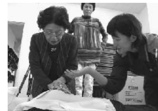
■救急車が到着するまでに応急手当をすることで、救命率が大きく向上します。

10月24日、ひとりでも多くの人に命の手助けをしてもらいたいと、白石消防署で個人を対象とした応急手当講習会が行われました。