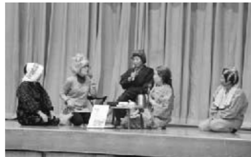
■「おかしいな」と思ったらすぐ相談を!