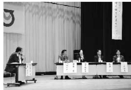
■白石の特産物に付加価値をつけて