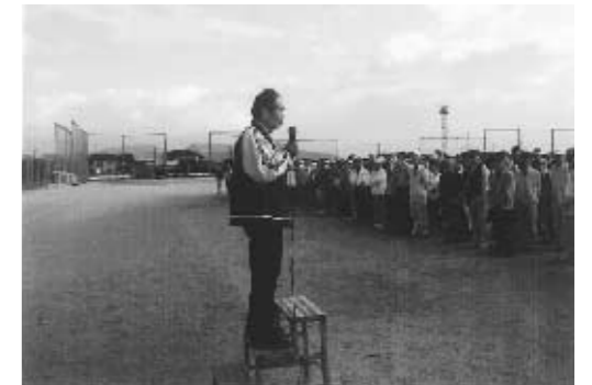
■皆さん精一杯頑張りましょう

〔総合優勝〕八千代会 〔準優勝〕戸ヶ里 〔3位〕中区 〔ホールインワン賞〕 74人 〔ニアピン賞〕 各パート2人 計8人