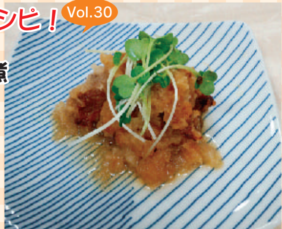
(1人分: エネルギー 226kcal 塩分 1.8g)

買ってきたお総菜が余ってしまったり、いつも同じ味に飽きてしまったら、野菜などを加えてアレンジすると、一味違ったおいしい一品に変身させることができます。