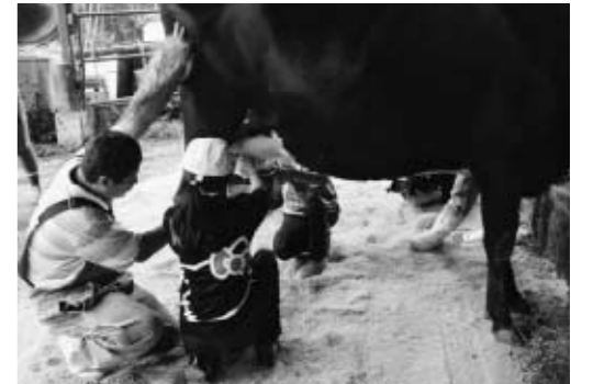
■牛を驚かさないうに優しく優しく