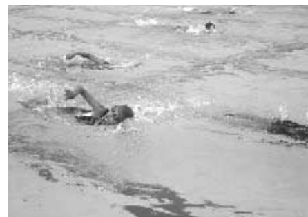
【体育の水泳の授業より】

水泳は、1、2年【水遊び】、3、4年【浮く・泳ぐ運動】、5、6年【水泳】という系統で学習します。 左は、高学年の水泳の学習の様子です。学習のねらいは、①今できる泳ぎ方で距離に挑戦、②新しい泳ぎ方で距離に挑戦です。自分のめあてに向かって黙々と泳いでいます。 この学習で、6年生は、クロール、平泳ぎ共に全員100メートル以上泳げるようになりました。