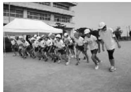
【体カアップ週間 持久走より】

水泳は、1、2年【水遊び】、3、4年【浮く・泳ぐ運動】、5、6年【水泳】という系統で学習します。 左は、高学年の水泳の学習の様子です。学習のねらいは、①今できる泳ぎ方で距離に挑戦、②新しい泳ぎ方で距離に挑戦です。自分のめあてに向かって黙々と泳いでいます。 この学習で、6年生は、クロール、平泳ぎ共に全員100メートル以上泳げるようになりました。