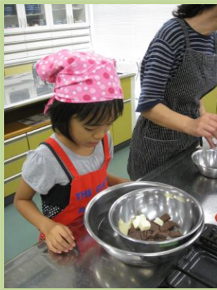
チョコレートを湯煎で溶かして