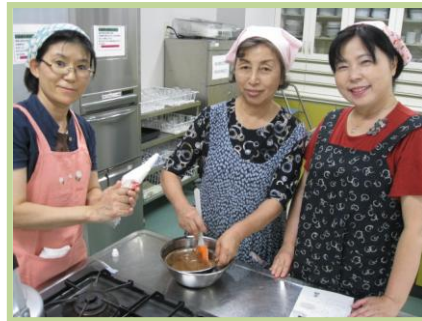
チョコクリームをつかってケーキの上のにせる