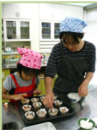
マシュマロやマーブルチョコを飾れば…