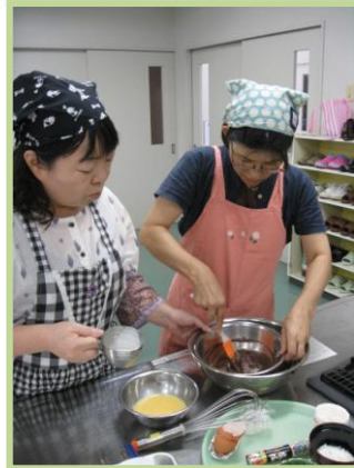
他の材料もいれて混ぜ混ぜ～