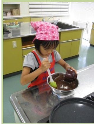
出来た生地をカップ型へ流し込む